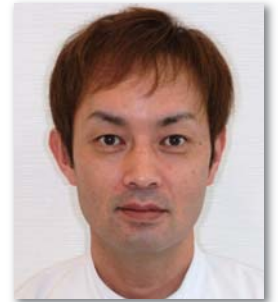
めぐみ歯科クリニック行橋 口腔外科インプラントセンター

手術後は、通常入院となり24時間全身管理を行います。全身麻酔を行える事により、多数本時のインプラント埋入や骨移植、サイナスリフト、ベニヤグラフト、など色々な術式に対応できます。