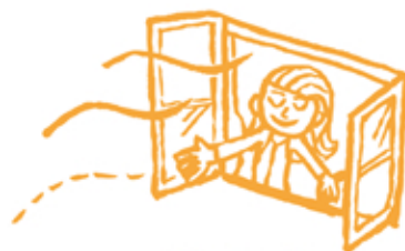
【今回のテーマ】 湿気対策

天気の良い日に窓を開け、クローゼットや押入れの扉を 開けておくだけでも、家全体の風通りが良くなって湿気を 防ぐことが出来ます。気をつけたいのは、雨の日。じめじめと 湿った空気を、室内に入れないことが肝心。結露が起きて いる窓ガラスは、こまめに拭き取ることで湿気が解消され 易くなります。風通しの調節を心がけて、晴れやかな気持ちで 快適に過ごしたいですね。